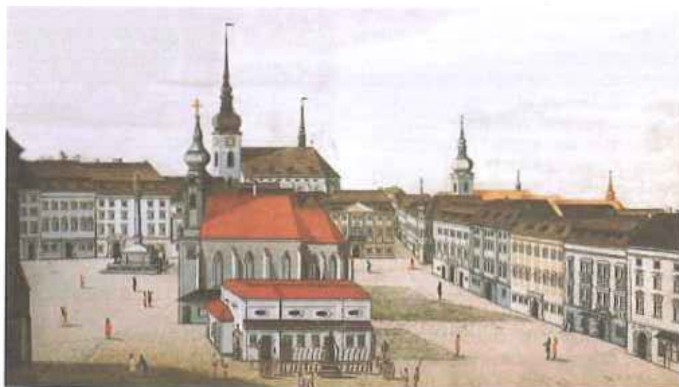
Dnešní náměstí Svobody (dříve Dolní trh) ještě s kostelem sv. Mikuláše, v pozadí věže Jakubského a jezuitského kostela.