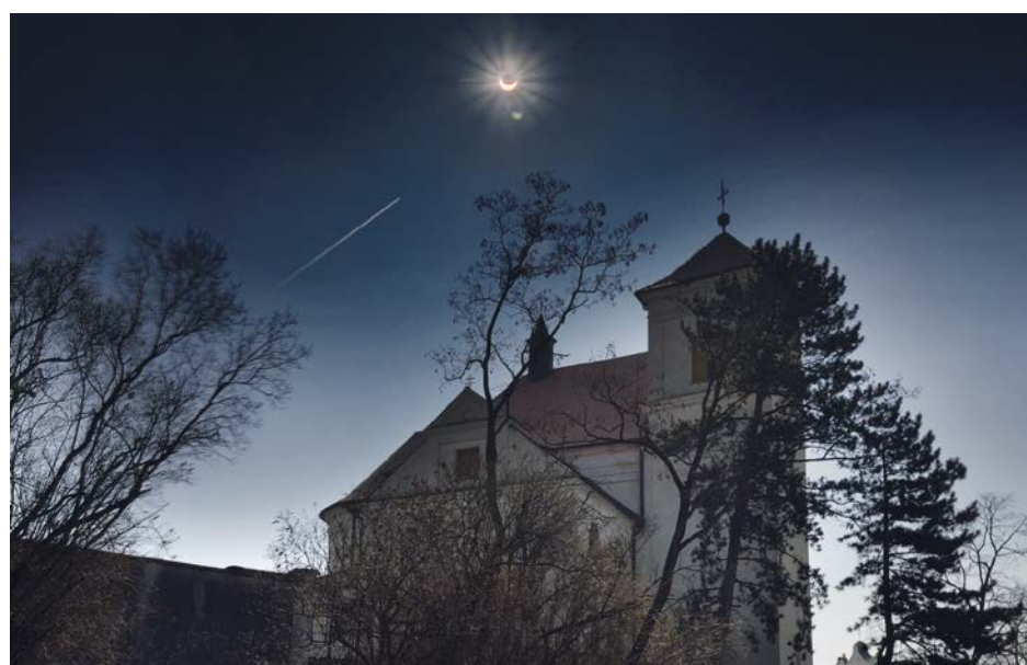
I u nás řada lidí pozorovala částečné zatmění slunce. Kostel v Obřanech, 20. 3. 2015, čas 10:47 hod.

Milí spoluobčané, uplynulých sedmdesát let života našeho národa v míru je z pohledu historie vskutku dobou výjimečnou. Přesto, že to nebyl život procházející růžovým sadem, zvláště pak v poválečných a následujících letech budování socialismu, přece jsme se přičiněním demokraticky smýšlejících občanů, dočkali tolik let upírané svobody. Děkujeme li v těchto májových dnech hrdinům, kteří se přímo se zbraní v ruce či nepřímo svojí ilegální činností podíleli na porážce nacistického zla, tak stejně díky patří i osobám, které byli nápomocni návratu demokracie a vytouženého návratu České republiky mezi