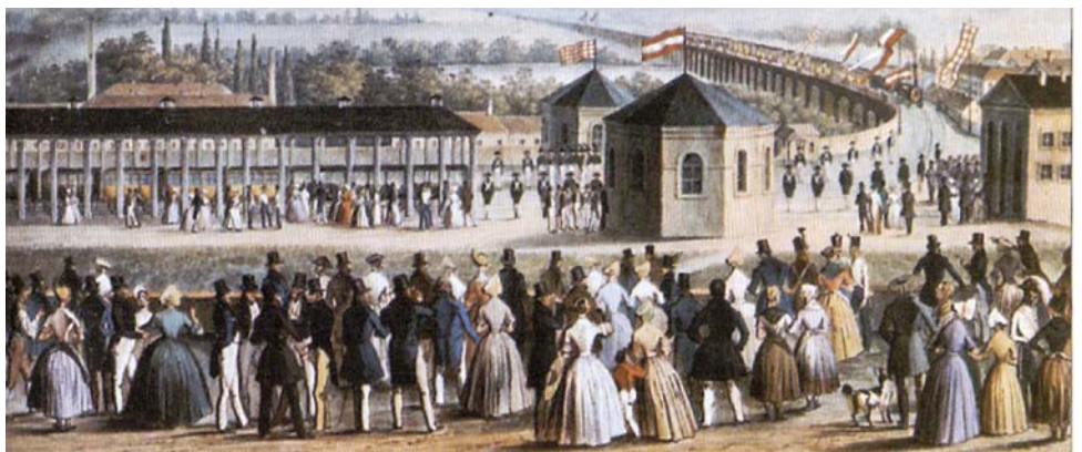
Příjezd prvního vlaku do Brna dne 7. července 1839